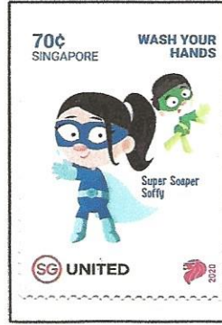
Wash your hands on a Singapore stamp.