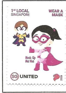
Wear a mask on a Singapore stamp.