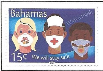
Wear a mask on a Bahamian stamp.