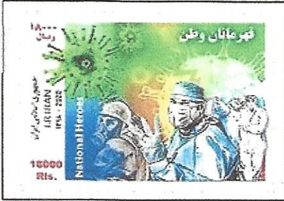
First postage stamp issued dealing with COVID-19 from Iran.

COVID-19 (SAR CoV-2) is the pandemic of the 21st century. The whole world had been infected and had killed more than 5.5 million people. More research had to be investigated because of different variants. Foreign countries start to issue postage stamp related to the topic because of its severity.