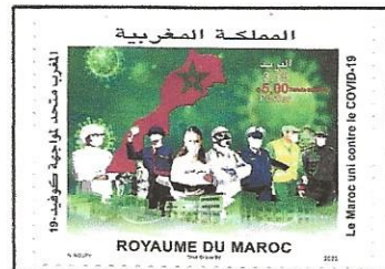
COVID-19 fighters on a Moroccan stamp.