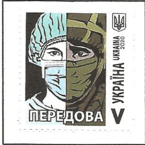
Wear a mask on a Ukrainian stamp.