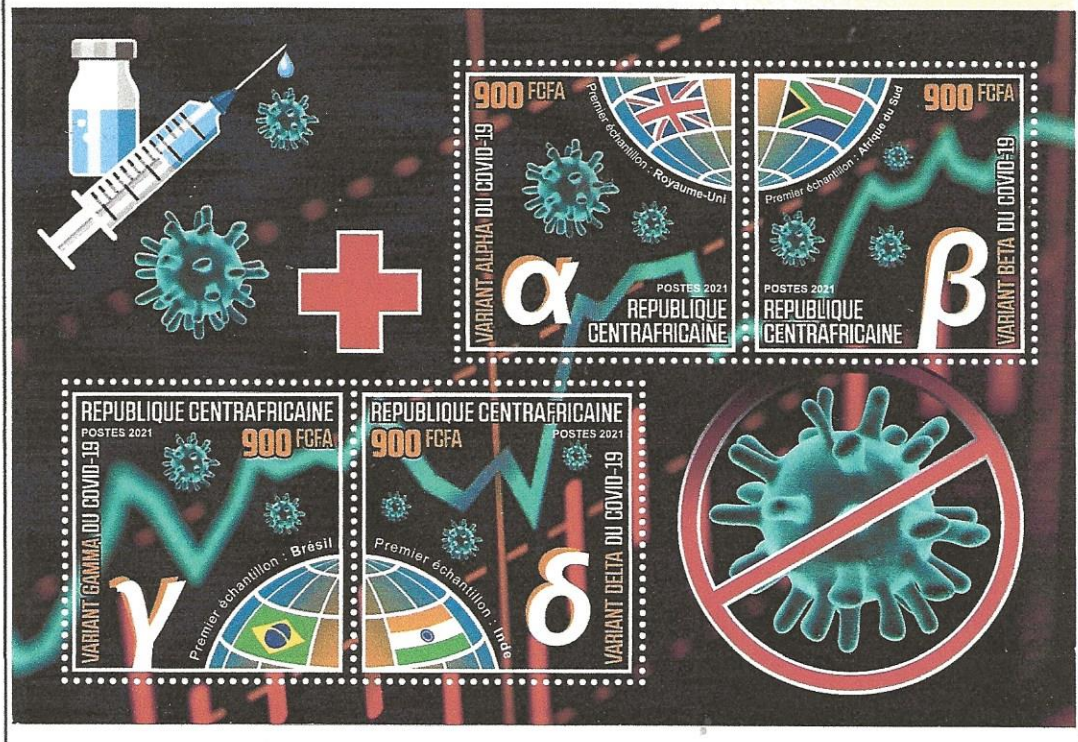
Different COVID-19 variants on a Republic of Central Africa souvenir sheet.

*Actuellement, le variant Delta représente le plus grand défi dans la lutte contre le COVID-19 à l'échelle mondiale