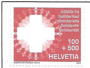
COVID-19 fund raising on a Switzerland stamp.