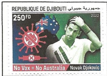
No vaccination on Australian a stamp.