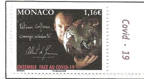
Fight the COVID-19 from a Monaco stamp.